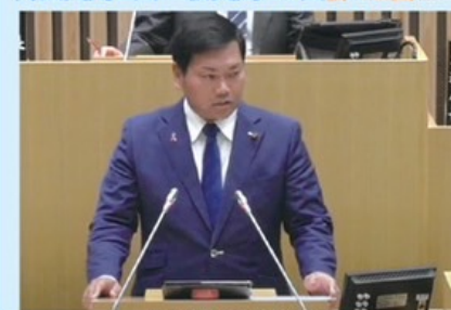
議場での登壇の様子